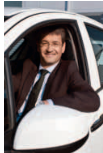
AC-Ladesäule Charge CP500A