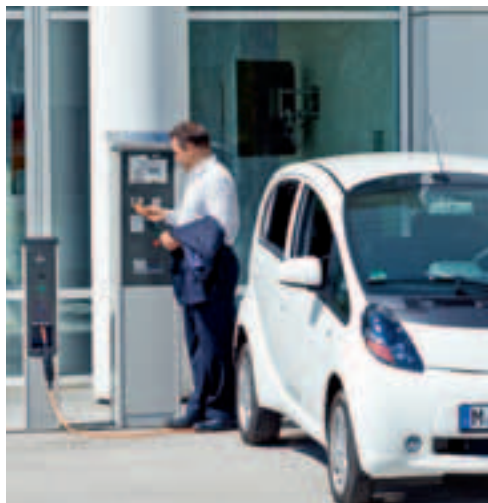
AC-Satellitensystem Sitraffic EPOS-P