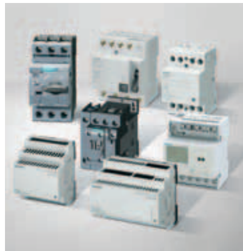
Komponenten für die Ladeinfrastruktur