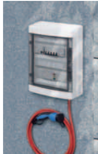
AC Wall Box Charge WB100A

Weitere Informationen: www.siemens.de/drivery