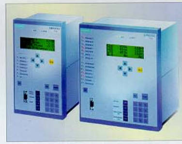
Bild 6. Die Abzweige der Windenergieanlage werden prinzipiell über jeweils ein Überstromzeit-Schutz-Relais geschützt. Durchgängig kommt dabei die Siemens-Schutzgerätebaureihe Siprotec 4 zum Einsatz

mator und je nach Anforderung aus einem oder mehreren Abgangsfeldern für die Windenergieanlage. Neben der Mittelspannungsschaltanlage befinden sich im Betriebsgebäude ebenfalls standardmäßig alle Sekundärschränke: