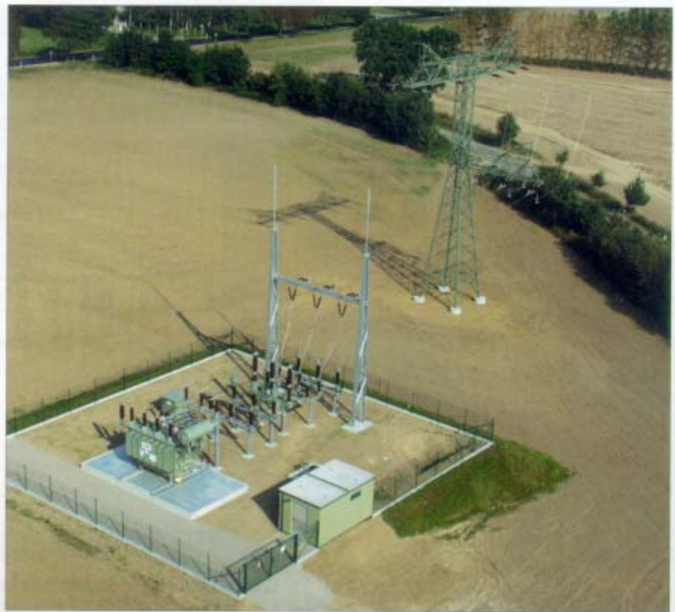
Bild 2. Windenergieanlagen-Umspannwerk Gägelow: Umspannwerke für Windenergieanlagen werden grundsätzlich in Freiluftbauweise gebaut