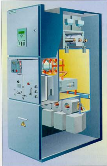
Bild 5. Die bei diesem Projekt verwendeten Schaltanlagen der Baureihe NX Plus C von Siemens PTD mit 1250-A- oder der Schaltanlagenbaureihe 8DH10 mit 630-A-Sammelschienenennstrom sind Lösungen, die in großer Stückzahl im Edis-Netz betrieben werden

Die Anlage besteht grundsätzlich aus einem Einspeisefeld zum 110/20-kV-Transformator, einem Feld für den Eigenbedarfstransfor-