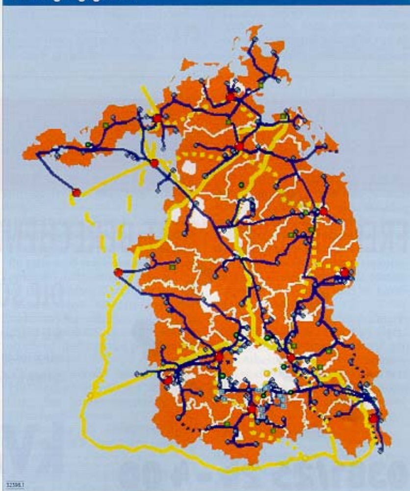
Bild 1. Anlagen des Edis-Netzes, Umspannwerke und Leitungen: Das Versorgungsgebiet der Edis AG erstreckt sich entlang der Ostseeküste von Schönberg bei Kiel bis Usedom über die beiden Bundesländer Mecklenburg-Vorpommern und Brandenburg von Rügen bis Jüterbog. Auf diesem Gebiet betreibt das Energiedienstleistungsunternehmen 146 Umspannwerke und 5.266 km 110-kV-Freileitungen